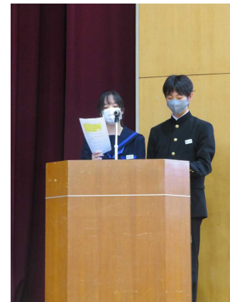
←代議員の2人。 司会進行、お疲れ様でした。

今回立候補するか真剣に悩んで、結局立候補せずに後悔しているという人もいました。立候補したかったけれど、他の活動との兼ね合いで遠慮したけれど、やっぱり立候補したかったという人もいました。立候補はできないけれど、立候補者を全力でサポートしようとしていた人もいました。様々な思いがありますが、少しでも心が動いてという人も含め、こんなにたくさんの人が生徒会役員選挙に真剣に向き合ってくれていたことがとても嬉しく、学年に関わる教師としてすごく誇らしかったです。